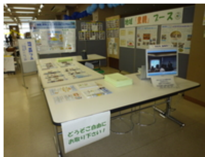
地域「里親」ブースの様子

中庭のエリアでは、昨年の初回に引き続き、「東近江市」が出店、揃いの赤いハッピーを羽織って、地域医療写真展と併せてジェラートと石焼きいもの販売などにより、盛んに市をPRされていました。