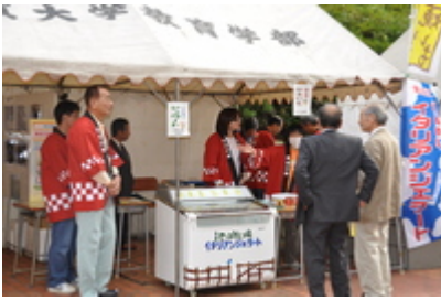
「東 近 江