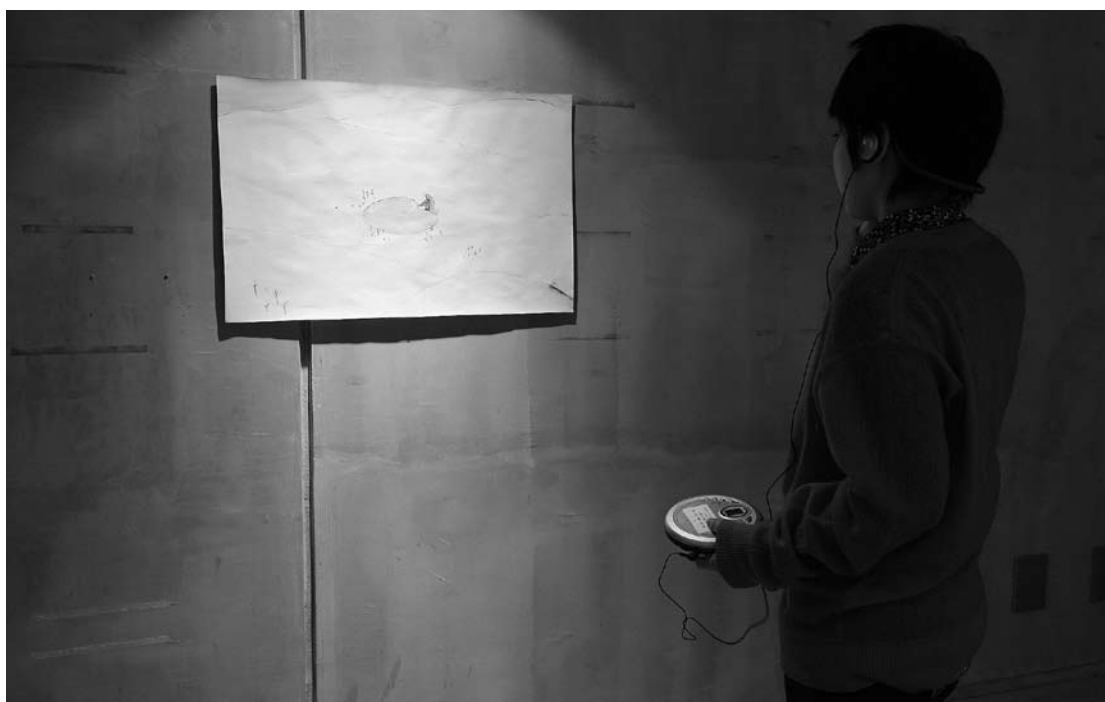
(写真下) 「泉の話」 2001年 絵：澤登恭子