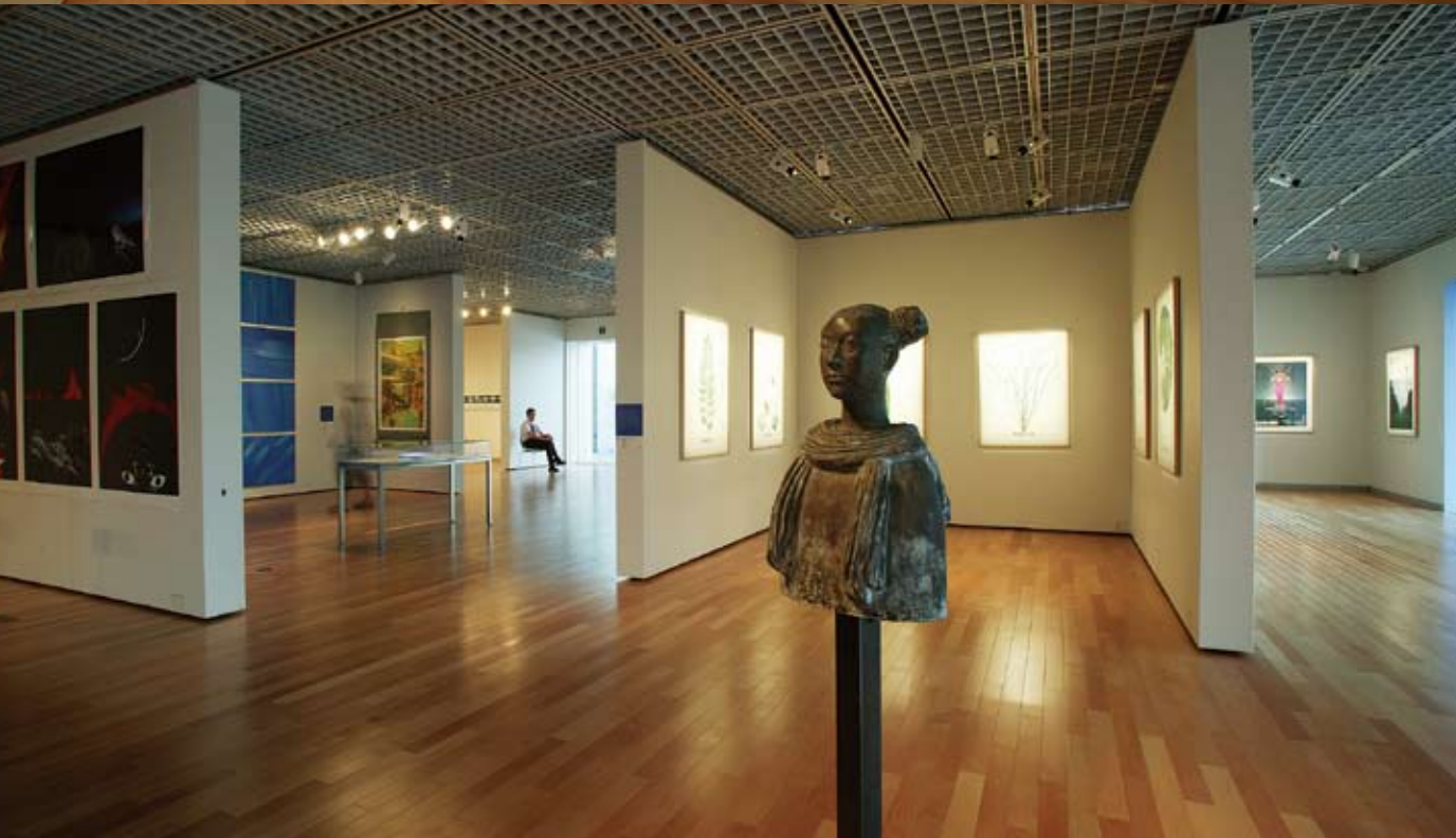
左頁（上下とも）「BANDED BLUE 一東北芸術工科大学の28作家」展会場風景 2005年9月16日～10月2日 鶴岡アートフォーラム（鶴岡市）