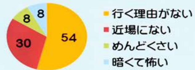
神社に行かない理由 (100人にアンケート)

参拝者が増え、神社が活性化する ことで、神社を通じた地域の人々の 繋がりが深まる