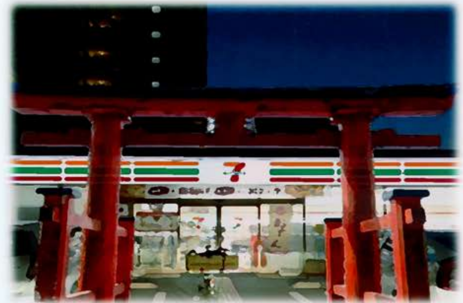
神社をコンビニのような身近な存在に…