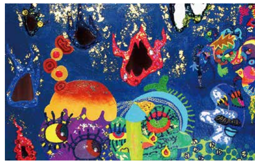
カズリ D 6F KAZURI