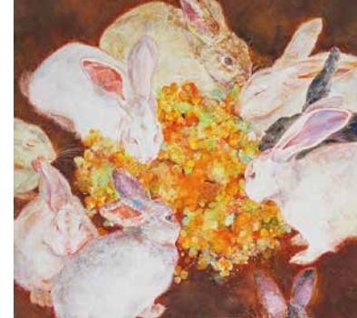
藤本 桃子 B Fujimoto Momoko