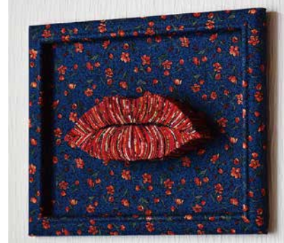
山本 圭子 B Yamamoto Keiko