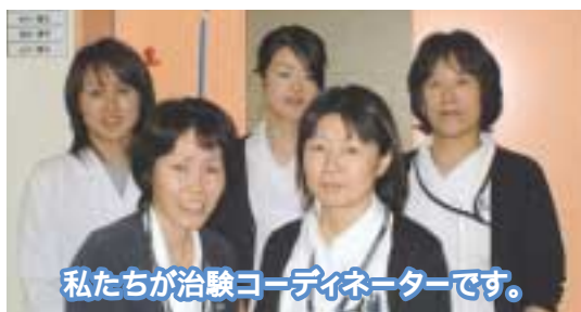
私たちが治験コーディネーターです。